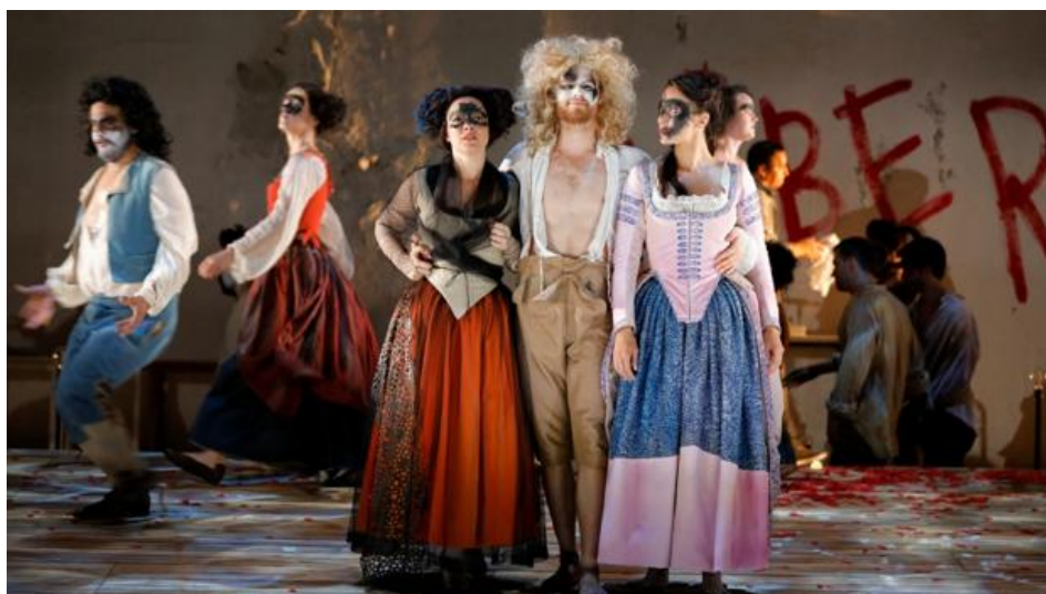
Escena de «Don Giovanni» - Aix-en-Provence

ALBERTO GONZÁLEZ LAPUENTE / Aix-En-Provence